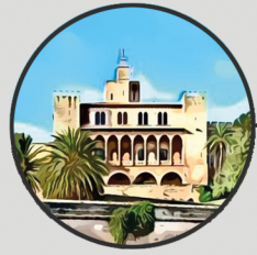
4. PALAU DE L'ALMUDAINA Carrer del Palau Reial, s/n