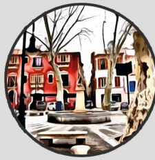
12. PLAÇA DE LA DRASSANA