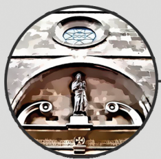
8. ESSLÉSIA DE SANT JOAN DE MALTA Carrer de Sant Joan, 9