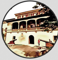
11. CONSOLAT DE LA MAR Carrer de la Llotja, 3