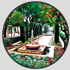
5. L'HORT DEL REI Av. d'Antoni Maura, 18