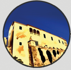
2. PALAU EPISCOPAL Carrer del Mirador, 5