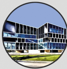
14. PALAU DE CONGRESSOS Carrer de Felicità Fuster, 2