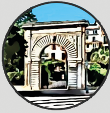
10. PORTA VELLA DEL MOLL Passeig de Sagrera, 6