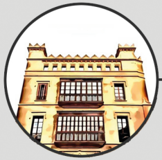
3. ORATORI DE SANT PAU Carrer del Mirador, 5