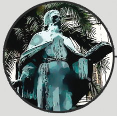
6. ESTÀTUA DE RAMON LLULL Passeig de Sagrera, 1