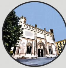
9. LA LLOTJA Plaça de la Llotja, 5