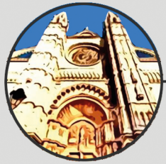
1. LA SEU Plaça de la Seu, s/n