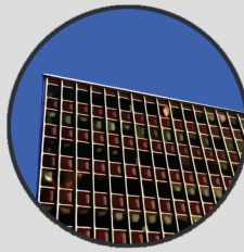
13. ANTIC EDIFICI DE GESA Carrer Joan Maragall, 16