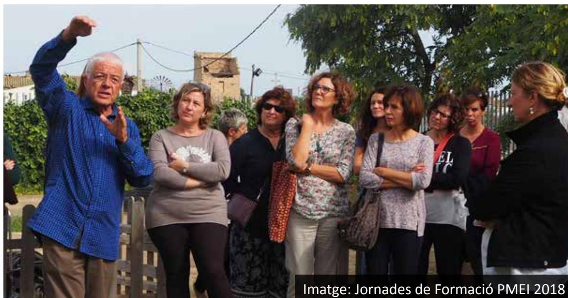
Imatge: Jornades de Formació PMEI 2018

A més, les escoles infantils del PMEI s'ofereixen com a centres de pràctiques per a l'alumnat que cursa estudis d'educació infantil a l'institut o a la Universitat, com una clara aposta per la formació inicial d'aquests perfils professionals.