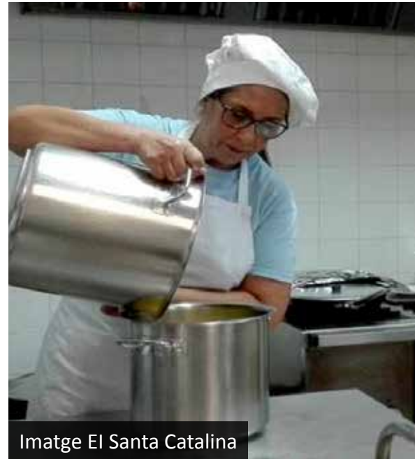
Imatge El Santa Catalina

del personal de cuina i supervisats pel Gabinet Tècnic de Sanitat de l'Ajuntament. D'aquesta manera s'assegura l'elaboració de menús saludables, alhora que també es valora la cuina com a motor d'aprenentatge.