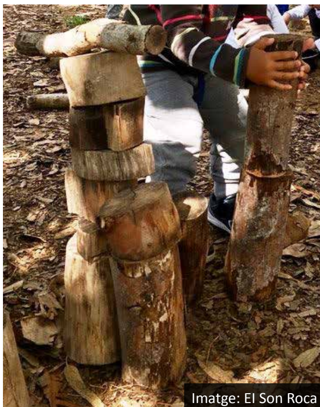
Imatge: El Son Roca

Des dels seus inicis, les escoles infantils del Patronat, s'han plantejat com a serveis educatius que vetlen pel creixement personal harmònic i que reconeixen, valoren i atenen la diversitat de la població que integra el terme municipal de Palma. Per aquesta raó, es procura una escolarització primerenca de qua-