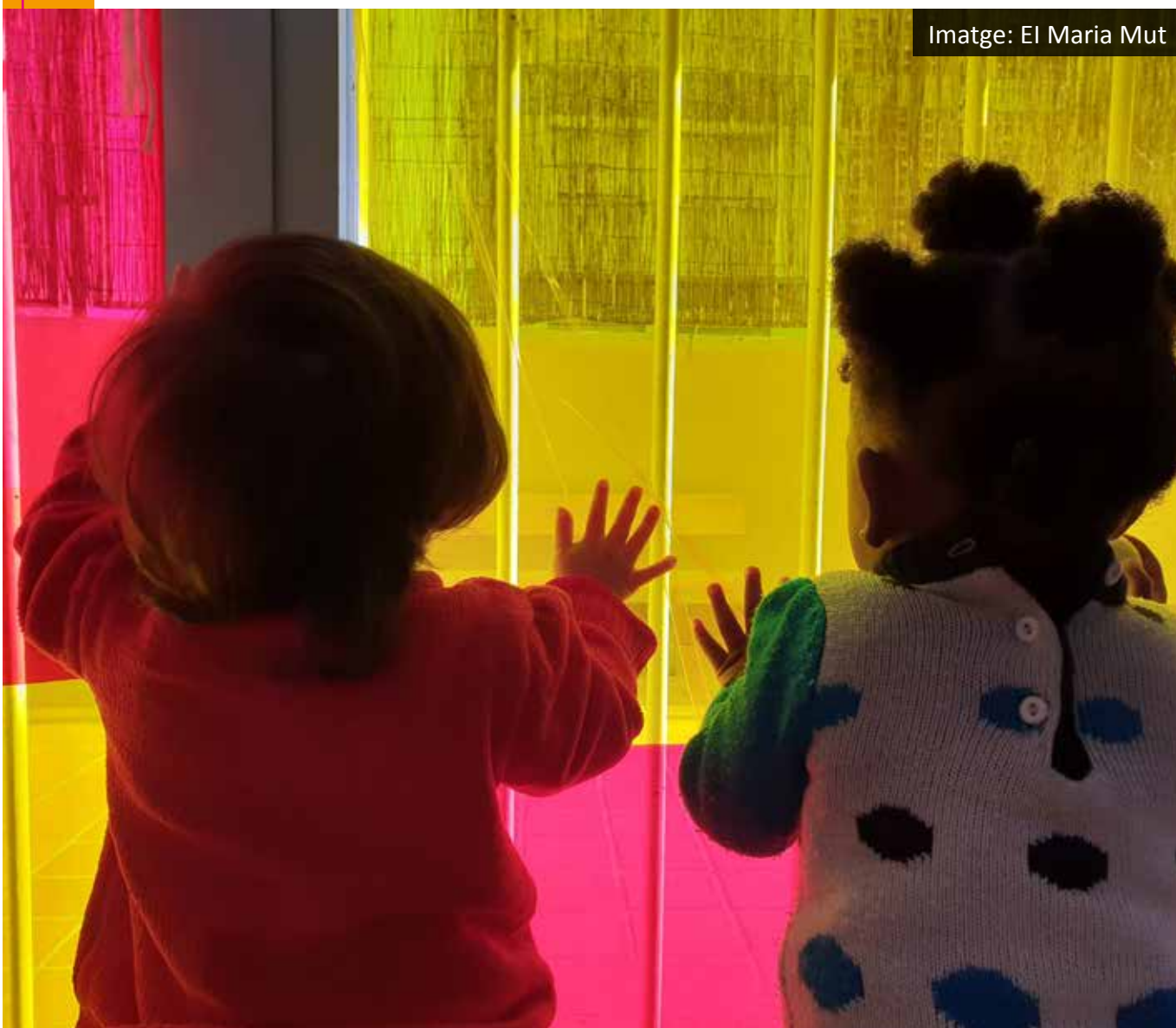
Imatge: El Maria Mut

Si l'infant no participa en les activitats del seu grup que es realitzin fora del centre durant la jornada escolar, el dia en què es faci la sortida l'infant no podrà assistir a l'escola (art. 12 del Reglament de règim intern).