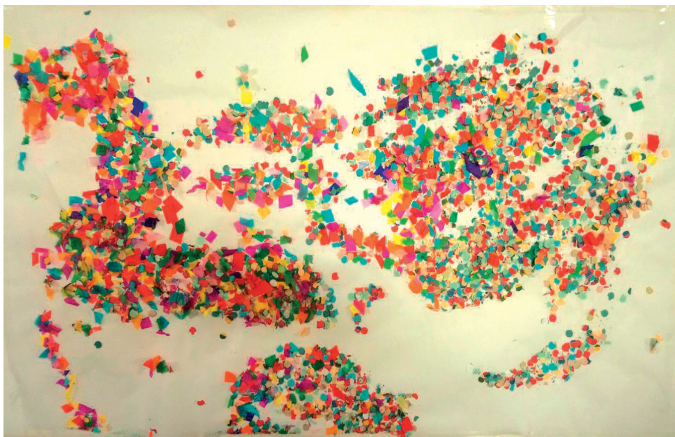
Aula 2-3 anys El Son Fuster